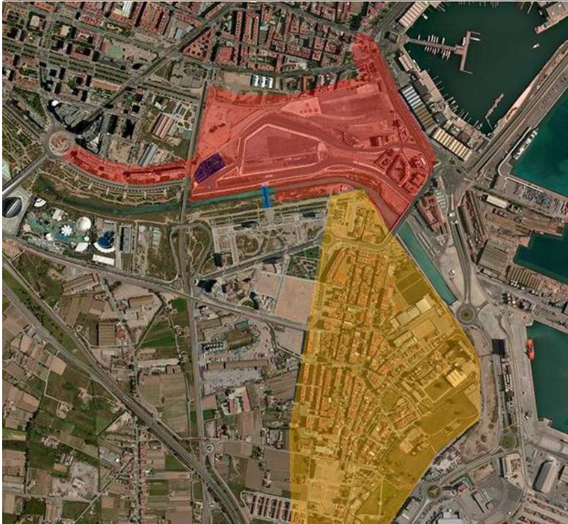
Nazaret Grau - Cocoteros Cementeri Cuc de l